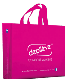
Depilève Fair Shopper Bag