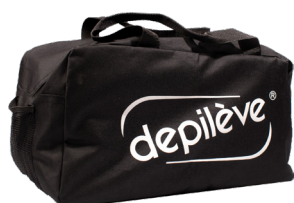
Depilève Student Bag Kit Black

Saco de desporto preto fabricado em tela resistente e com o logótipo Depilève, ideal para transportar kits.