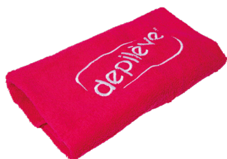
Depilève Fuchsia Towel 100 X 150

Bonita toalha de cor fuchsia, em algodão tecido de 500g com o logótipo DEPILÈVE bordado. Ideal para tapar a cabeceira da marquesa e melhorar o conforto do cliente.