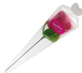
Depilève Pink Flower/Towel

Esta toalha cor de rosa em forma de flor é ideal para oferecer como material promocional e de marketing - excelente elemento decorativo.