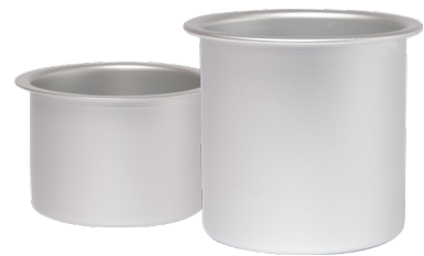
Wax Warmer Insert

Ref: VLDERCEL2 / Bipolar Ref: VLDERCEL1 / Tripolar