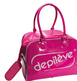
School Kit Pink Bag Depilève

Saco espaçoso para kits com o logótipo Depilève - ideal para pessoas em fase de aprendizagem ou profissionais de estética que fazem deslocações.