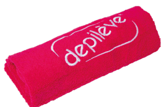
Depilève Fuchsia Towel 100 x 50

Bonita toalha de cor fuchsia, em algodão tecido de 500g com o logótipo DEPILÈVE bordado. Ideal para tapar a cabeceira da marquesa e melhorar o conforto do cliente.